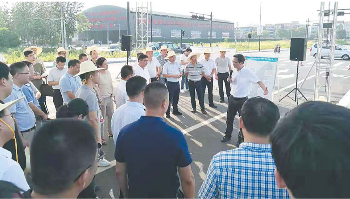
市领导现场督察全域土地统筹利用。

坚持节约资源和保护环境是基本国策,党的十八大和十九大报告都明确“坚持节约优先、保护优先、自然恢复为主的方针,形成节约资源和保护环境的空间格局、产业结构、生产方式、生活方式”。近年来,我市高度重视自然资源节约利用,2019年全面开展了全域土地统筹利用工作,并作为“一号工程”“一把手工程”来抓,全面落实自然资源管理新职责,深化自然资源节约集约利用,深入推进我市农村土地制度改革三项试点,助力乡村振兴和生态文明建设,助推义乌国际贸易综合改革试验区建设。