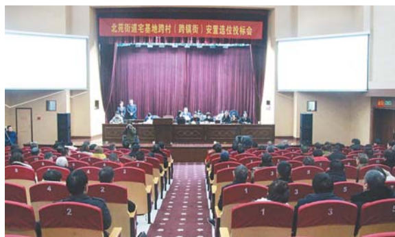
宅基地跨村投标选位竞标现场。

按照全域土地统筹利用工作的总体部署,市自然资源和规划局率先制订印发了《全域土地统筹利用自然资源管理十件事》,并加强督察考核,狠抓工作落实,较为圆满地完成了年初的目标任务。围绕职责抓落实,今年,市自然资源和规划局重点抓好十件事的落实——